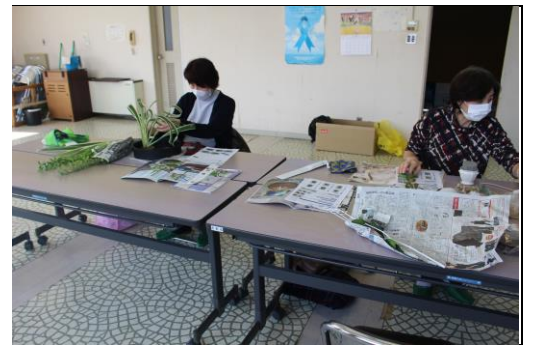
創作に身が入ります

東京直送の花なので、この辺では見たことがない花も使えるので、皆さんに喜ばれています。