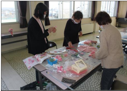
和気あいあいの雰囲気を楽しんでいます

瀬波地域コミュニティセンター・瀬波体育館・瀬波児童館を利用して活動している 団体・サークルを紹介していきます。興味があったら、ぜひのぞいてみませんか。