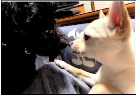
左(黒)が「レオン」右(白)が「ハナ」

我が家の家族を紹介しま す。毛色や性格、真逆なところ が多いですが、追いかけてこ 大好き仲良しな2匹です。 1匹目はトイプードル6歳 の「レオン」です。怖がりな性 格ですが、とても心優しい男 の子です。 2匹目はチワワとポメラニ アのミックス4歳の「ハナ」 です。好奇心が旺盛で元気が っぱいの女の子です。 2匹は散歩が大好きです。 雨の日など散歩が難しい日は 家中をドッグランのように走