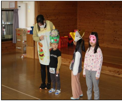
作ったお面を紹介

この日は園児たちが遊戯室に集まり、最初に保育士から『節分の意味』と『なぜ豆まきを行うのか？』についてわかりやすく丁寧に説明がありました。そのあと未満児・黄色組（3歳児）・白組（4歳児）・青組（5歳児）の順に自分たちが作った鬼の面を紹介しました。