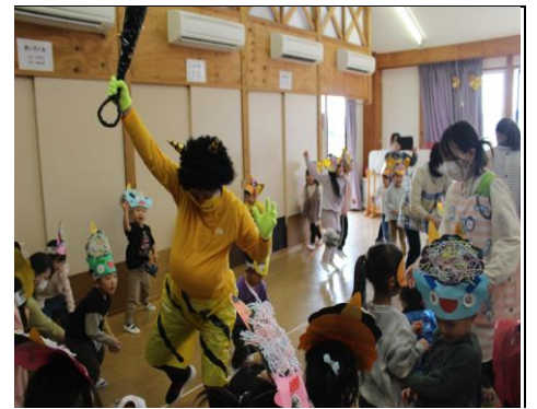
暴れる鬼を退治するぞ

すると突然、赤鬼・青鬼・黄鬼がお遊戯室に乱入してきた。鬼の姿を見た園児の中には、思わず泣き出して動けなくなると園児もいました。鬼はそれぞれ「寝ぼすけ鬼」「怒りんぼ鬼」「泣き虫鬼」「イヤイヤ鬼」と紹介され、園児たちは自分の心になかに潜んでいる「鬼」を退治しようと、「鬼は外！福は内！」と大声で豆に見立てた丸めた新聞紙を鬼にめがけて投げていました。たまたま鬼たちは遊戯室から退散していき、最後に園長先生からのお話で幕を閉じました。