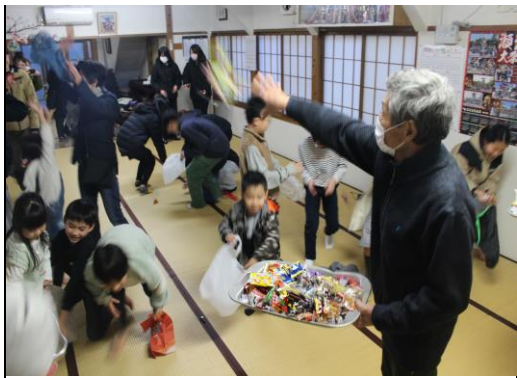
威勢よくお菓子をまきます

当日は町内役員や子どもたち、その親御さんを含め、約30人の参加があり、お菓子やチョコレートを役員が撒くと