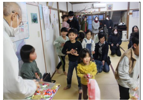
毎年盛り上がります