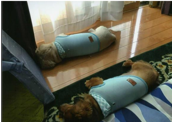
仲良くお昼寝をします