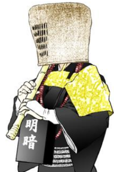
尺八を吹く虚無僧

虚無僧は深編み笠で顔を隠し、武士であるため腰には刀を差しています。尺八を吹きながら全国を修行して回り、悟りを得ることを目指しています。