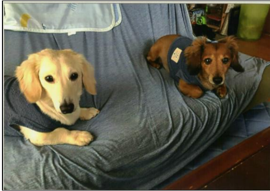
左 むぎちゃん 右 ちょこちゃん

我が家の家族を紹介しま す。ミニチュアダックスの "ちょこ"と"むぎ"です。9 歳と4歳の男の子です。 "ちょこ"は、散歩が大好 きでどこまでも歩きます。" むぎ"は散歩が苦手であら ではおっとりとしてゴロゴロ しています。 性格も真逆な二人が仲良く 昼寝している姿に毎日ほっこ りとしています。