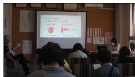
健康講演会 （けんこう福祉部会）