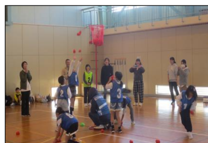
スポーツ玉入れ大会 （ふれあい交流部会）