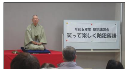
防犯講演会 （あんしん安全部会）