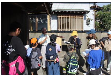
瀬波歴史ウォーク （ふるさと歴史部会）