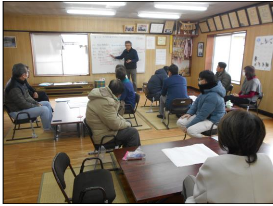
町内を挙げて課題解決に取り組んでいます

このような背景を受けて、緑町一丁目では昨年10月に「町内運営検討委員会」を立ち上げ、