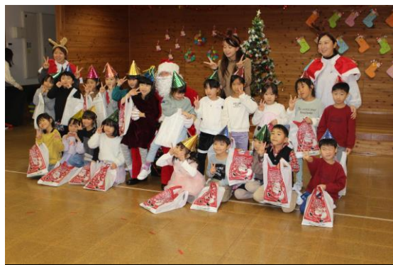
サンタさんとハイ!チーズ!

輪になり、ジングルベルの歌に合わせて一緒に踊りました。そしていよいよお楽しみプレゼントが園児に手渡されます。温かい言葉をかけながらプレゼントを手渡ししてました。プレゼントを受け取った子どもたちは、その瞬間の喜びを全身で表現し、目を輝かせていました。「ありがとうございます、サンタさん!」という声が響き渡り、その様子はまさにクリスマスその醍醐味と言えるものでした。その様子を見ていた保育士たちも自然と笑顔になり、心温まるひとときを過ごしました。イベントの最後には、全員で「メリークリスマス!」と声を揃えて挨拶し、しめくくりました。