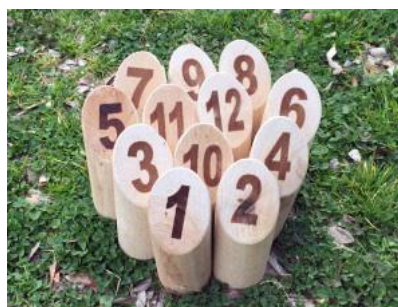
スキttl 倒すピン。 全部で12本あり1～ 12の番号が書かれてま す