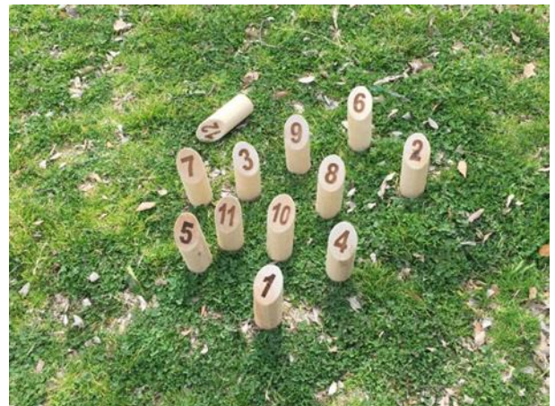
1本だけの場合は「書かれている数字」が点数(この写真は12点)