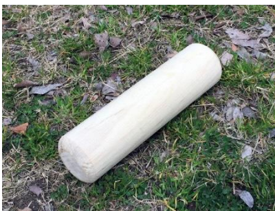
モルック 20cmぐ らいの木製の投げる 棒