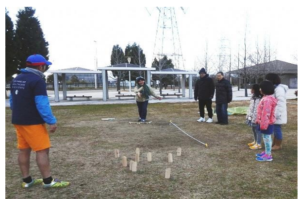
スキttlを倒して点数を競う