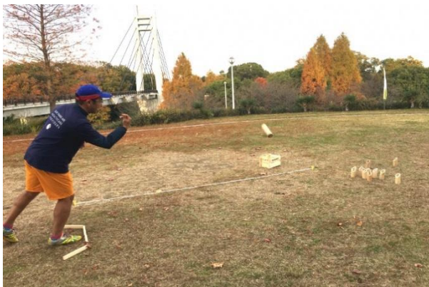
モルックを投げて