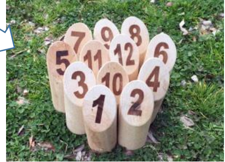
スキットル 各番号の並べる位置

II. 2チーム以上で対戦するので、投げる順番を決め、得点表に記載します。チームが交互にモルックを投げてスキットルを倒します。得点表はいろいろなフォームがありますが、とった点数と合計点を書くのは同じです。