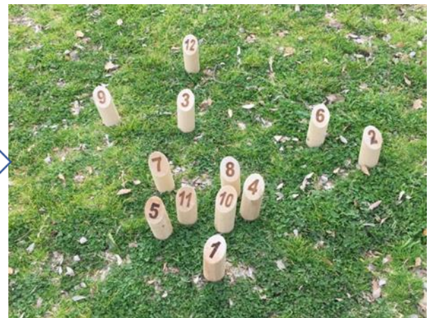
倒れた地点に立てます

Ⅳ. チームが交互（順番）に投げて、チーム内メンバーも順番に投げて、50点を先取したチームが勝ちです。