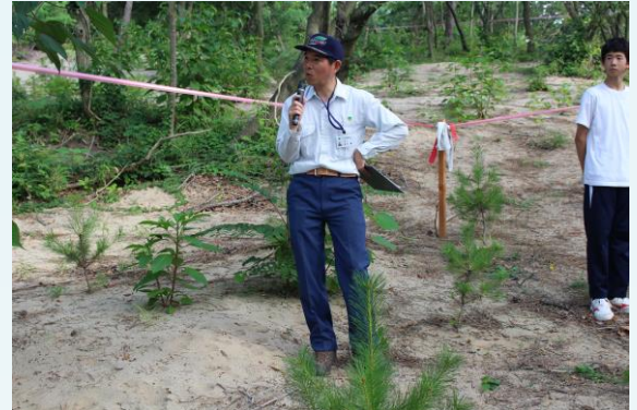
今年の4月に着任された、下越森林管理署高木村上支所長様からの挨拶

7月11日(火)に、瀬波地区区長会と中等教育学校の生徒と一緒に、松波町の浜山に植林した松の下草刈りを行いました。この活動は、平成18年からは中等教育学校の生徒がボランティア活動ということで、毎年7月頃に区長会と下越森林管理署の職員の方と一緒に下草刈りを行っています。当日は梅雨明けしたかと思わせるような晴天で、夕方にもかかわらず気温が30度を超える暑い気候の中、瀬波地区区長会から18名、中等教育学校の生徒約80名が参加して行われました。