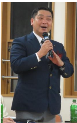
姫路敏市議会議員